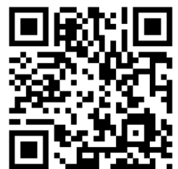
QR Code ไฟล์สลิป